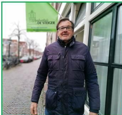
* Dit is een willekeurige foto van een van onze bezoekers; en staat los van de inhoud van deze persona