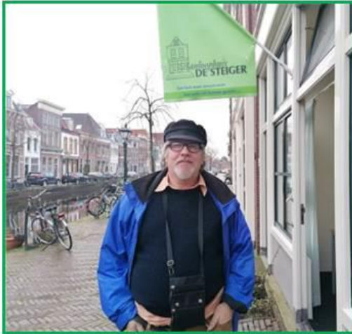
* Dit is een willekeurige foto van een van onze bezoekers; en staat los van de inhoud van deze persona