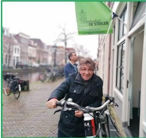
* Dit is een willekeurige foto van een van onze bezoekers; en staat los van de inhoud van deze persona