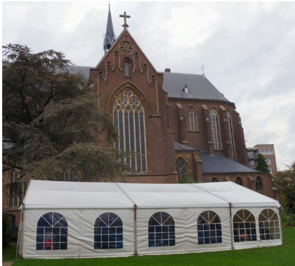
Feestelijke dag bij St. Petruskerk in oktober 2021

Een overzicht van organisaties en instellingen waar wij mee samenwerken is terug te vinden op onze website.