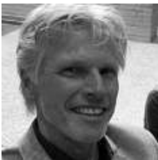
Jan van Opstal