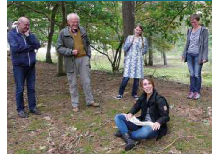
Enkele teamleden van het Annahuis.

Tevens functioneert de ANBI-status als een soort keurmerk, omdat de instelling dan aan een aantal voorwaarden voldoet. Sommige fondsen eisen zelfs een ANBI-erkenning, omdat dat een zekere mate van vertrouwen uitstraalt. We zijn verplicht onze balans en verlies- en winstrekening te publiceren. Nadat de jaarrekening 2017 is goedgekeurd wordt deze op onze website www.annahuis.nl gezet. ■