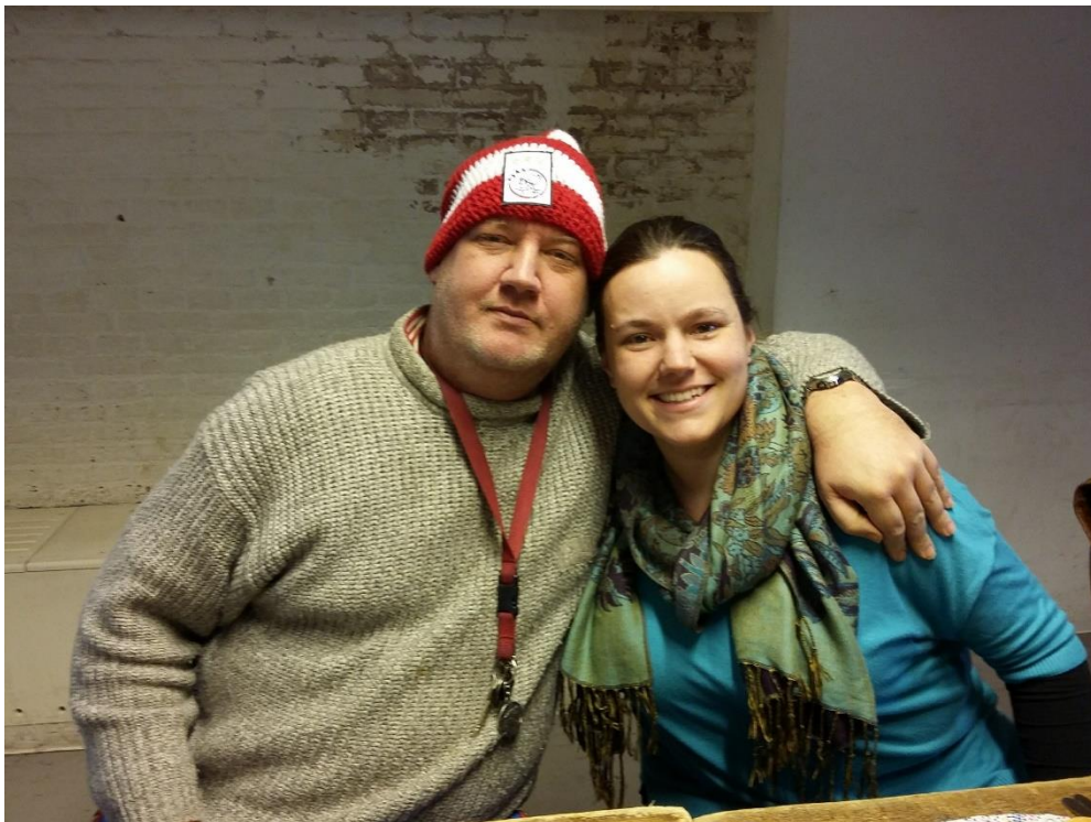
MIJN EERSTE VRIJDAG BIJ DE STRAATKLINKERS

'Waar ben je thuis'. Met die vraag wil ik mij als straatpastor bezighouden. Een plek waar je veilig bent, waar je op adem kan komen en waar je je (even) mag ontdoen van alle labels. Een plek waar je mag zijn wie je bent. Dat vraagt om veel tijd, aandacht, luisteren en signaleren. Vervolgens delen we deze verhalen ook breder. Omdat we hopen dat iedereen zich thuis kan weten in Amsterdam.