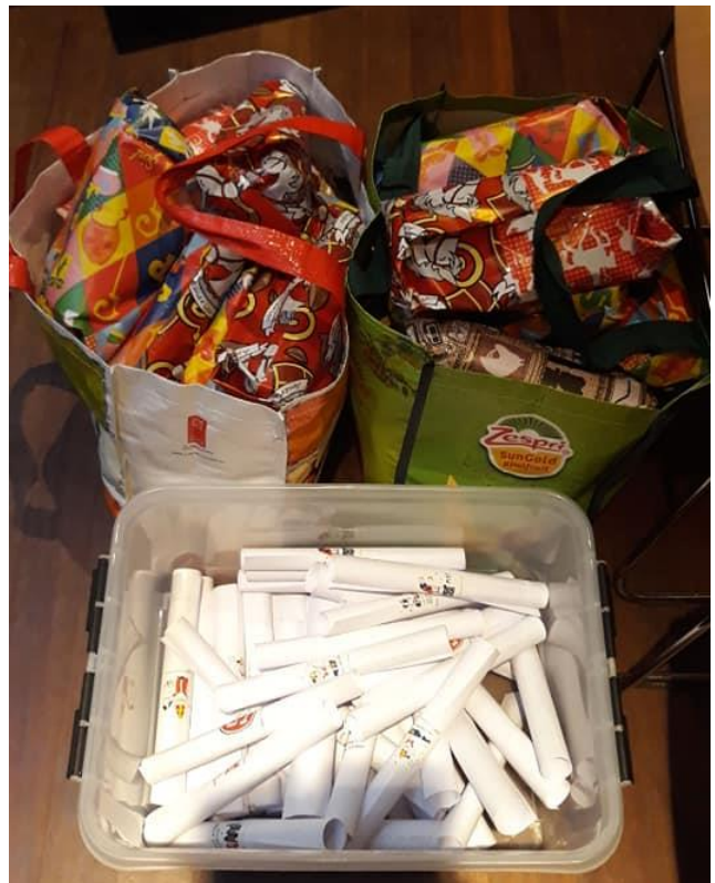
SINTERKLAASGEDICHTEN EN CADEAUTJES