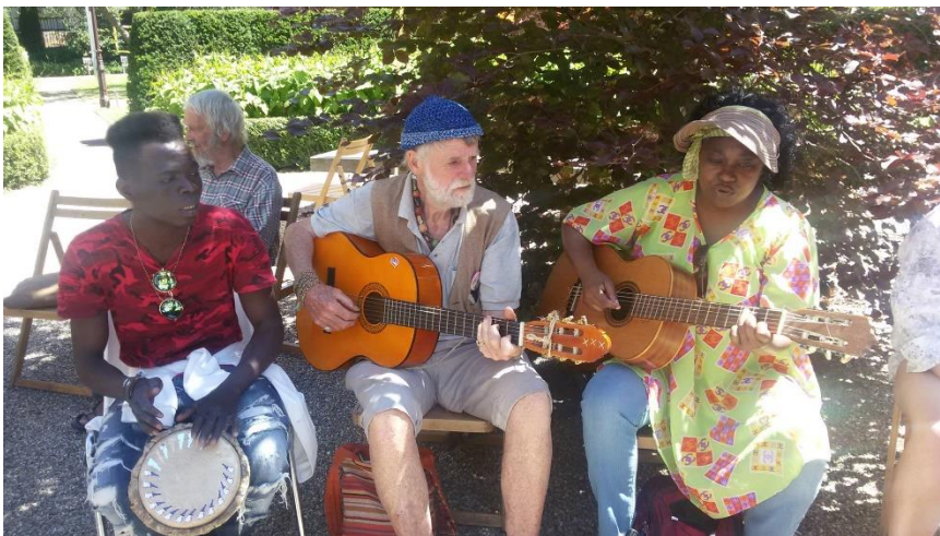
SAMEN ZINGEN MET HET WERELDHUIS