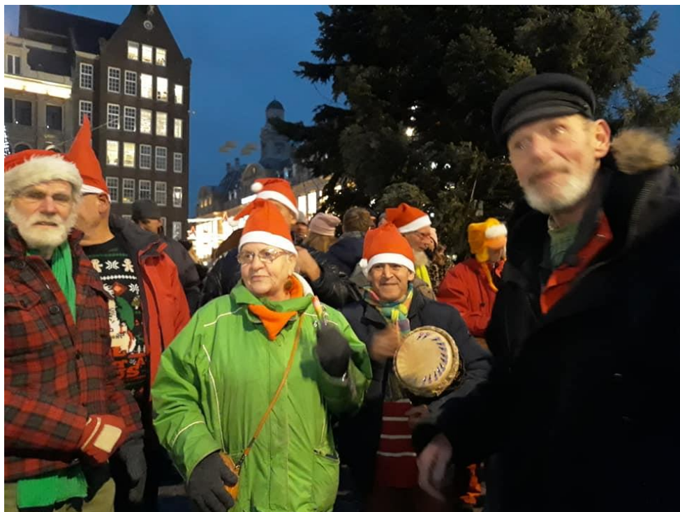
ZINGEN OP DE DAM ALS DE KERSTBOOMVERLICHTING AAN GAAT