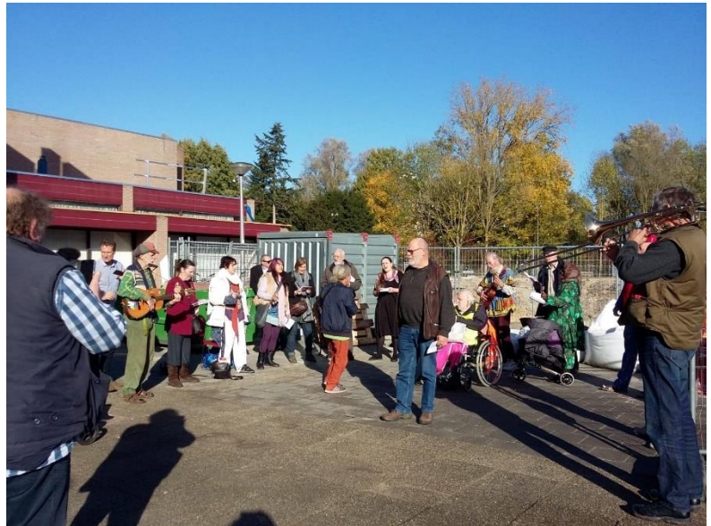
OPTREDEN IN ZEIST