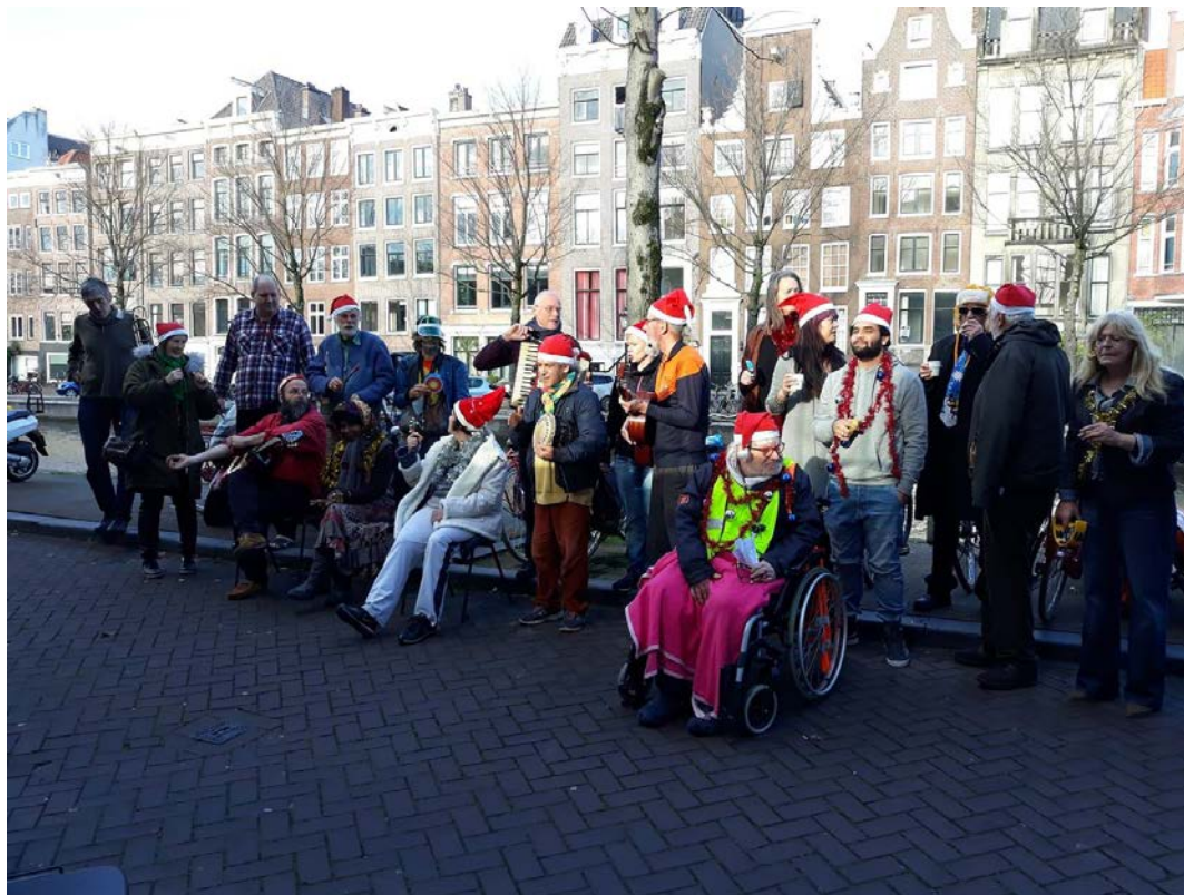
OPNAMES VAN 'ZEG KEN JIJ DE OMBUDSMAN'