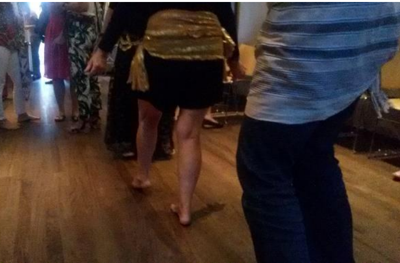
EEN AVONDJE BUIKDANSEN

Het Sinterklaasfeest wordt altijd door het straatpastoraat georganiseerd en ook dit jaar werd er geweldig gehoor gegeven aan de oproep om gedichten te schrijven voor “sterke vrouwen die zich staande weten te houden in een moeilijke wereld”. Van rederij Stromma hadden we een boottocht langs het Amsterdam Light Festival gekregen dus mochten de vrouwen op 4 december eerst op de boot en daarna tijdens de erwtensoep hun gedicht en cadeautje in ontvangst nemen.