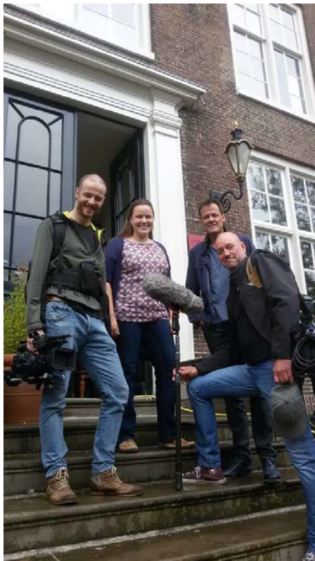
REPORTAGE MAKEN VOOR NIEUWLICHT