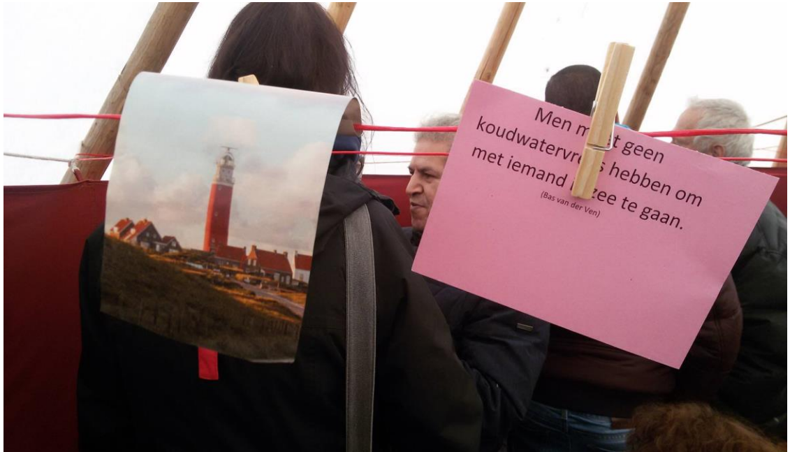
IN GESPREK MET BEZOEKERS VAN HET JUBILEUM FESTIVAL VAN DE HAËLLA STICHTING