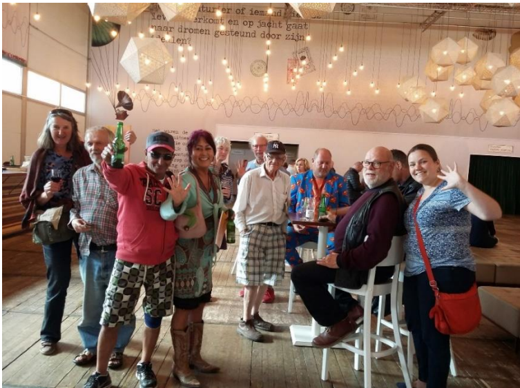
UITJE NAAR SOLDAAT VAN ORANJE