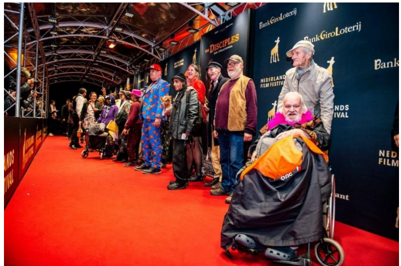
OP DE RODE LOPER