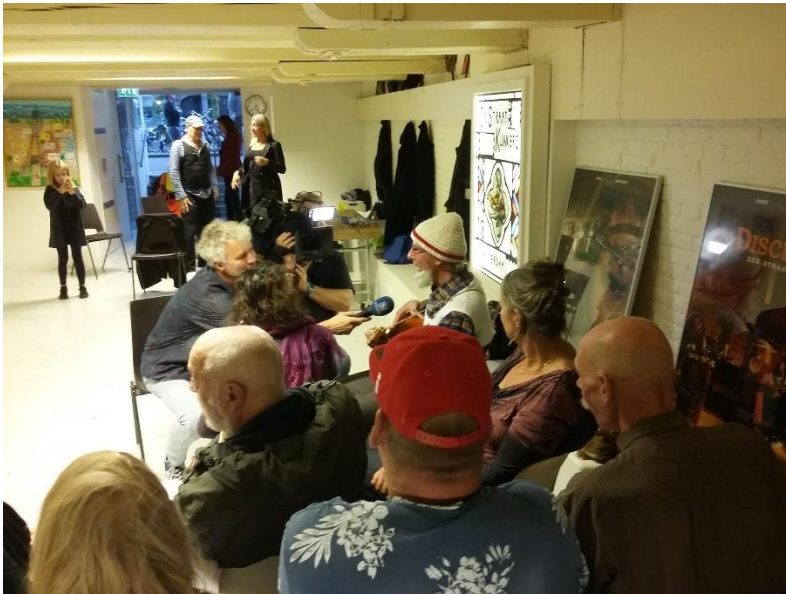
INTERVIEW MET NIEUWSUUR